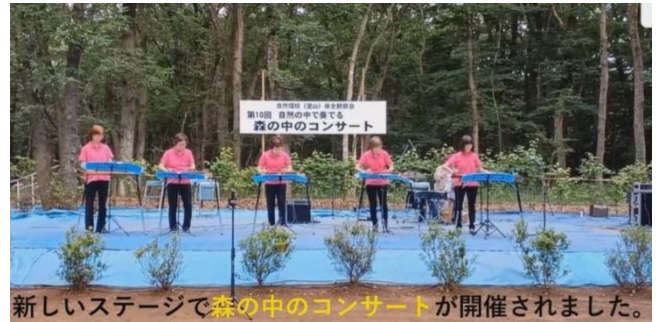
新しいステージで森の中のコンサートが開催されました。