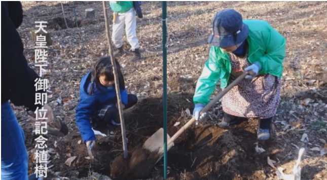
天皇陛下御即位記念植樹