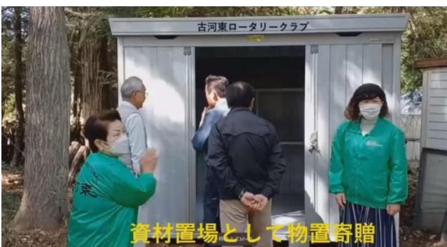
資材置場として物置寄贈