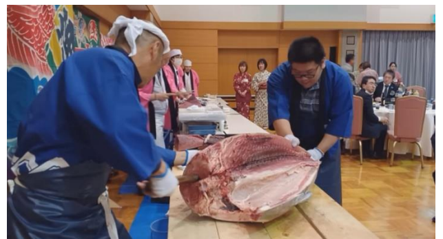
お疲れさまでした！！