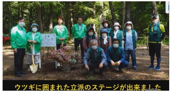
ウツギに囲まれた立派のステージが出来ました