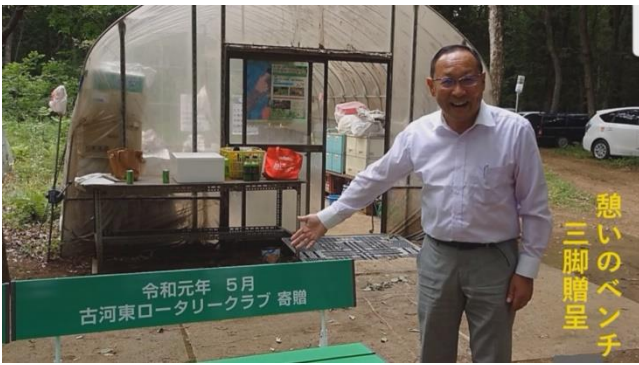
憩いのベンチ 三脚贈呈